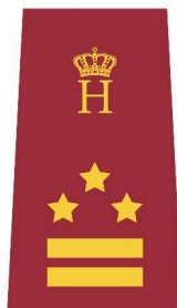
Lieutenant-colonel / DMS