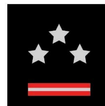
Caporal-chef 1ère classe