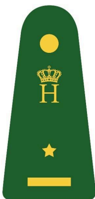
Lieutenant-aspirant / GIS