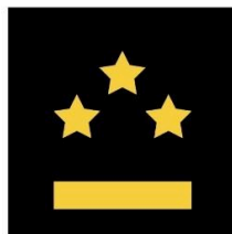
Lieutenant 1ère classe