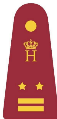
Major / DMS